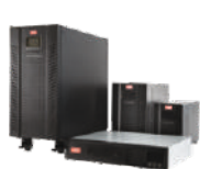
UPS CES GX 1 - 10 kVA