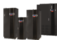
UPS CES SIGMA 10 - 500 kVA