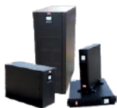
UPS CES OMEGA 1 - 30 kVA